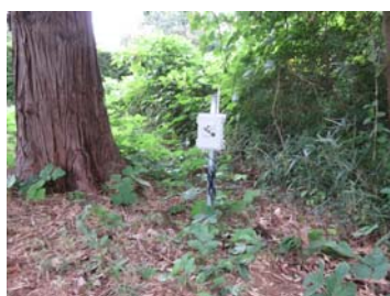
地温の観測ノード