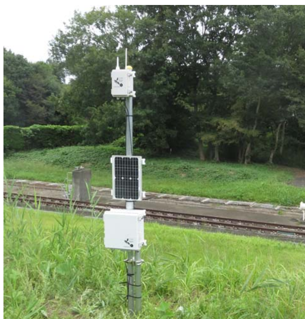
地温観測とLoRa/3Gゲートウェイ