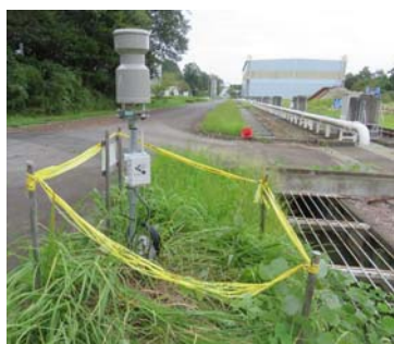
水位 + 雨量の観測ノード